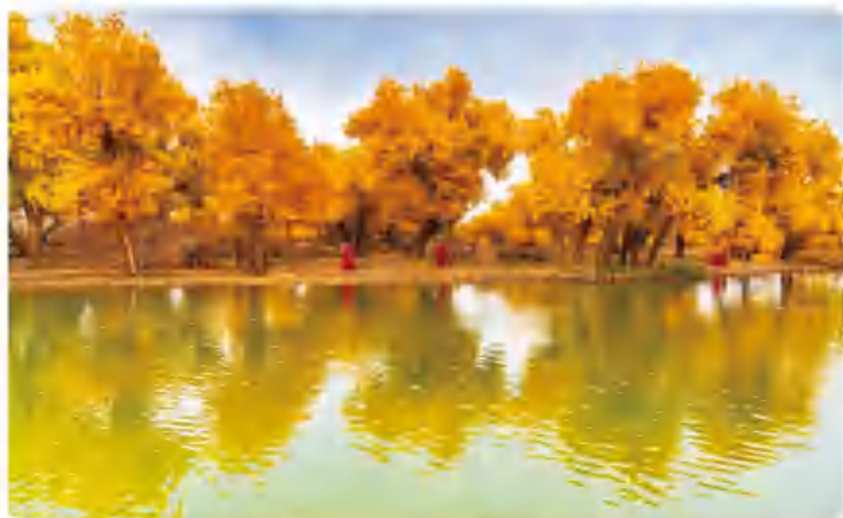
胡杨林——流光溢彩盛装起舞

你要有时间，一定要去看看额济纳的秋天，那里是大漠胡杨林的天堂，一年只美 21 天的地方。这里的胡杨林千姿百态，形状不一，有的笔直挺拔，有的老树盘根。在这个季节胡杨林呈现着铺天盖地的金黄色，一睹万亩胡杨林给你带来的震撼，大地尽铺黄金甲！