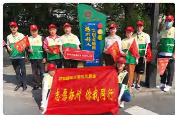
花园国际志愿者展现党员本色