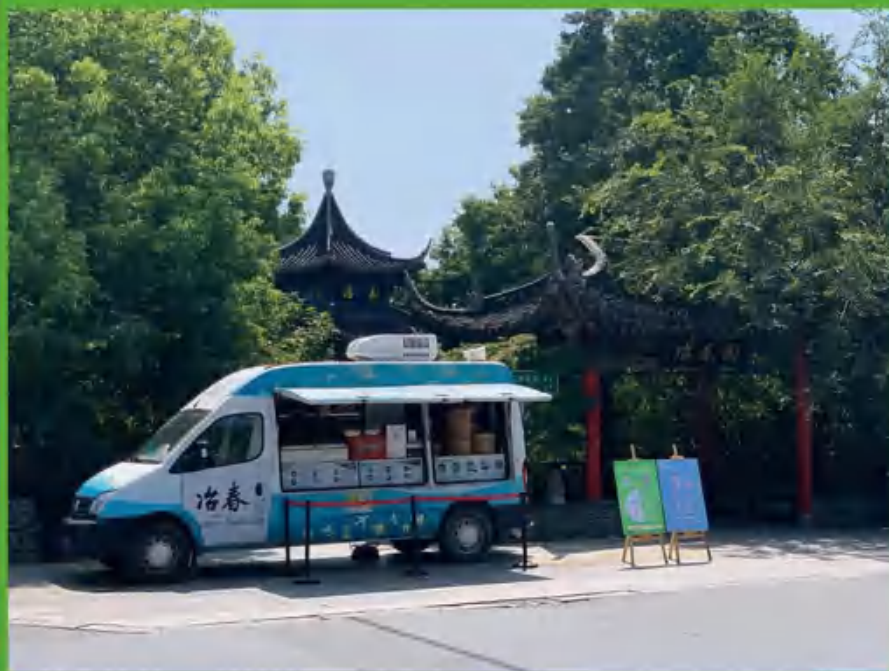
两家冶春打造保供后盾