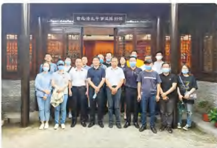
置业公司党支部参观曹起潜故居