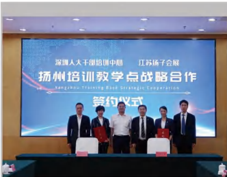
深圳人大培训中兴战略合作