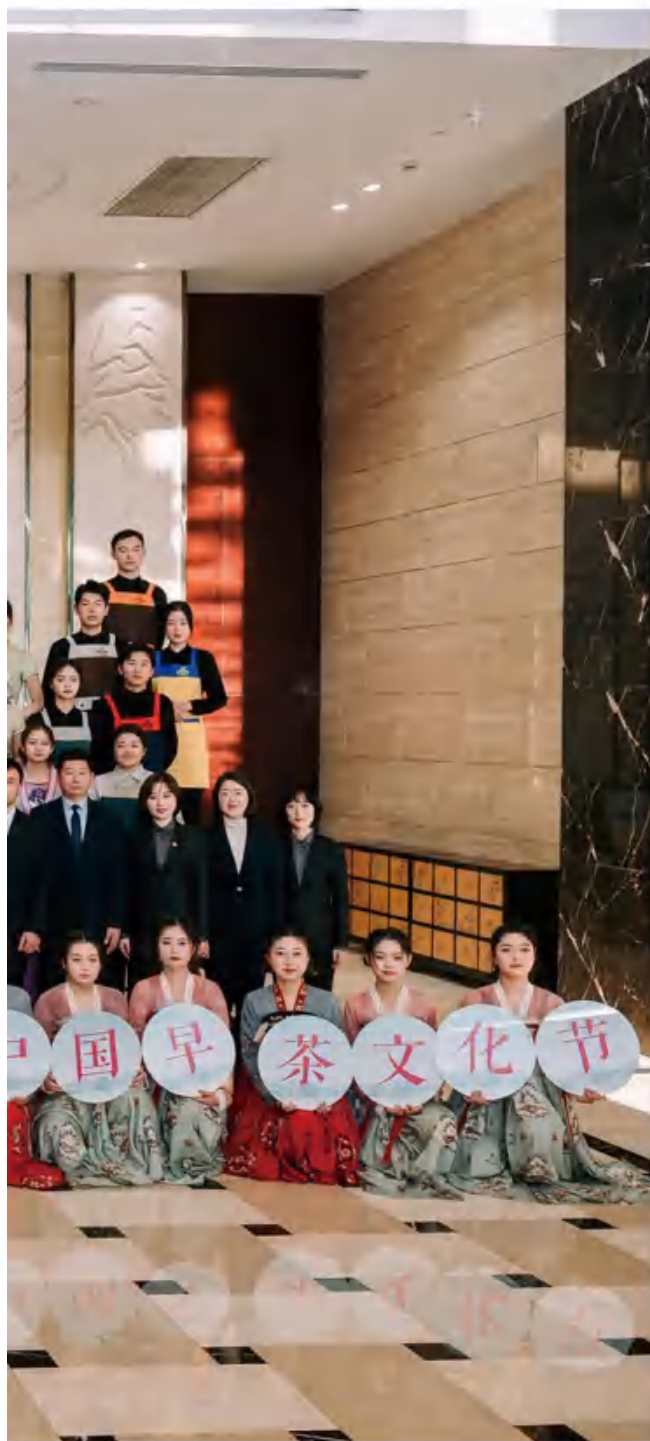
2021中国（扬州）国际创意美食博览会