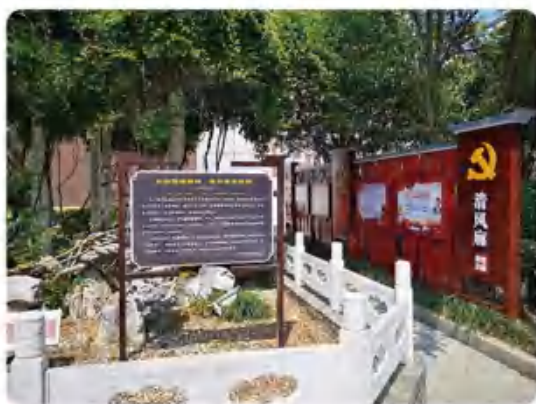
清廉走廊丹枫亭，让“廉”味更浓