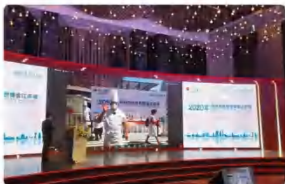
迪拜世博会“江苏周”活动隆重开幕

下午，2020年迪拜世博会“江苏周”活动在南京连线迪拜，通过“线上线下+全球直播”方式隆重举行，新华社进行了同步直播，吸引了71.5万人在线观看。“扬州冶春、中国味道、世界美食”的主题演绎，为“世界美食之都”增光添彩。