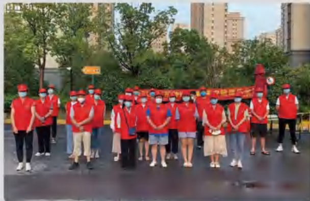
集团志愿者服务社区、服务社会