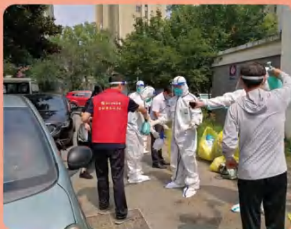
金融集团疫情防控志愿服务