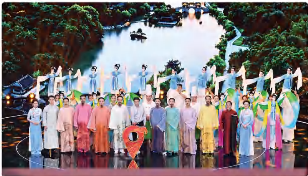
集团领淮扬菜实力出镜《中国地名大会》第二季