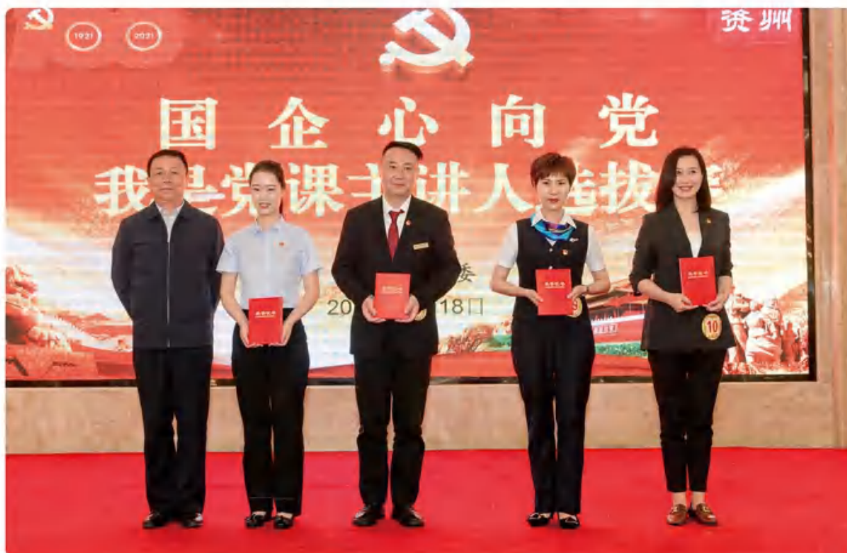
置业公司荣获“国企心向党，我是党课主讲人”