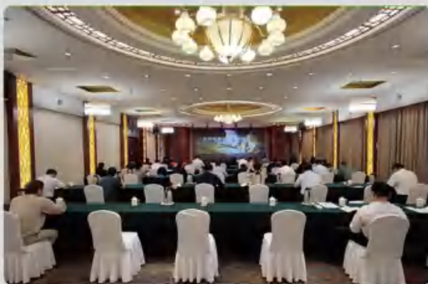
党史学习教育专题党课

一是以上率下“引领学”，启动党史学习教育活动，召开动员大会深入贯彻中央关于党史学习教育会议精神，成立党史学习教育领导小组，集团领导班子率先垂范，各基层党组织书记作为党史学习教育第一责任人，亲自抓、带头学。