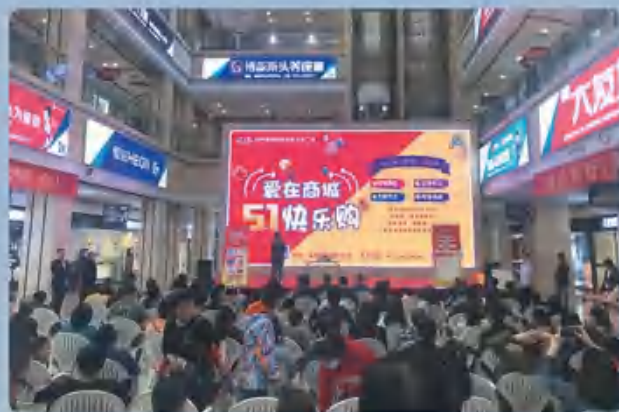
商城五一快乐购活动

扬州商城围绕“3.15”“五一”“端午”家装节点以及榆林农产品展销、开展各类营销活动40多次，带动市场商户销售增长5000万，有力促进了市场商户商品销售提升；通过全员招商、联合招商和服务招商，出租率超91%。珍园引进新业态，形成餐饮、娱乐、休闲、文化多业态协同发展的格局，上半年出租率达100%，在扬州商业体中保持领先态势。