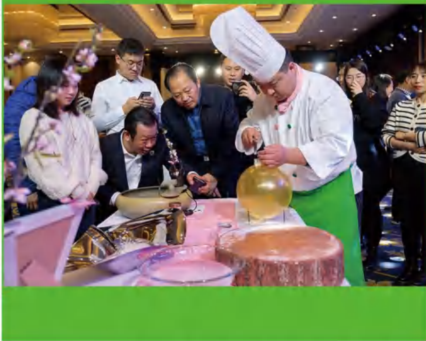
第三届中国早茶文化节集团“五名”产品惊艳亮相