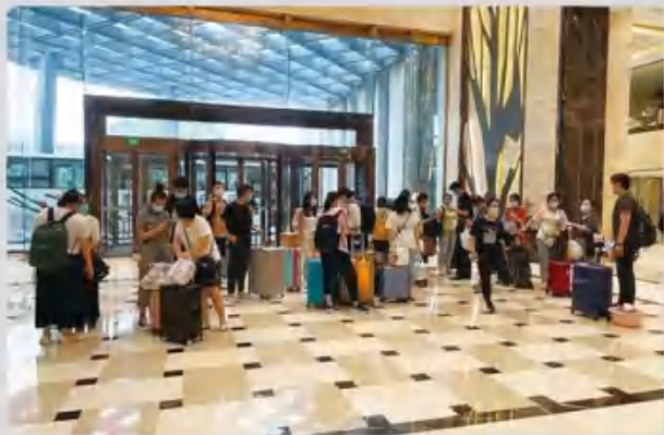
宾馆酒店全力服务各类人群