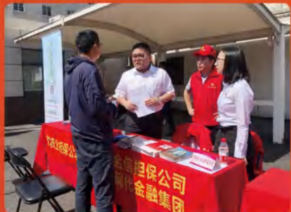
金融集团走进邗江区槐泗镇“金融市集”