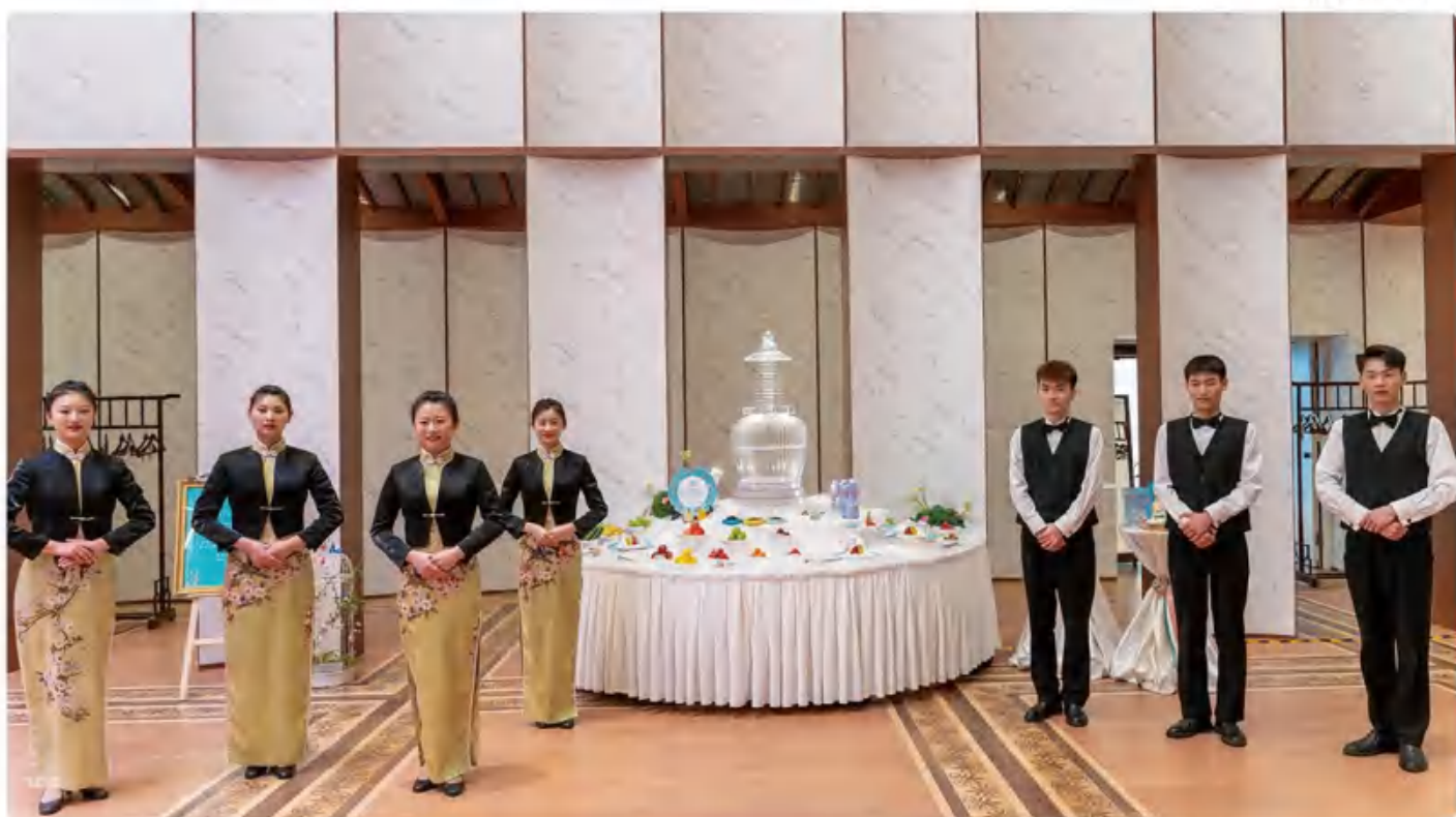
扬子江集团“一日5餐 为食扬州”茶歇惊艳亮相