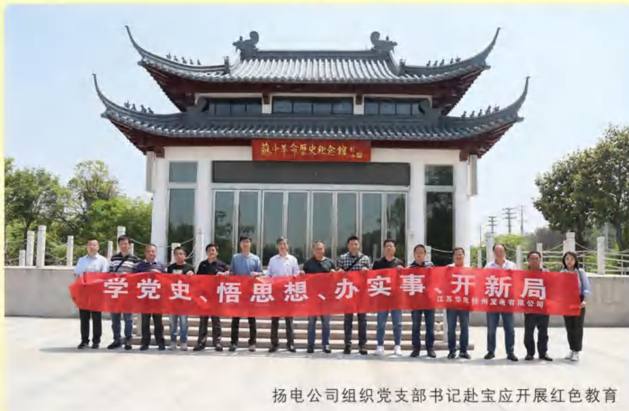
扬电公司组织党支部书记赴宝应开展红色教育