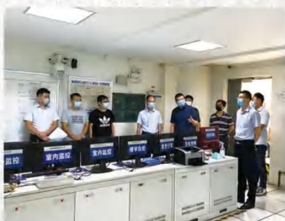
连续“作战”值夜班.....集团有个153人抗疫志愿者团