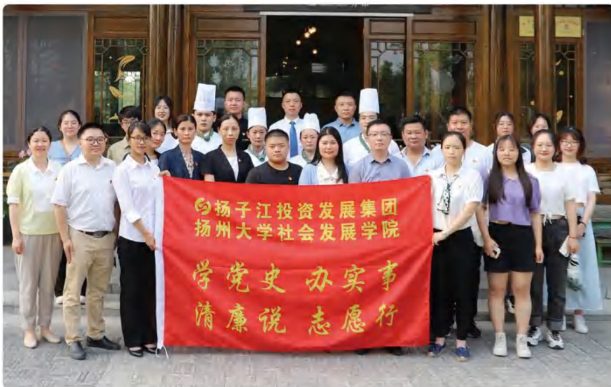
实事帮扶沿湖村 共话清廉传家风