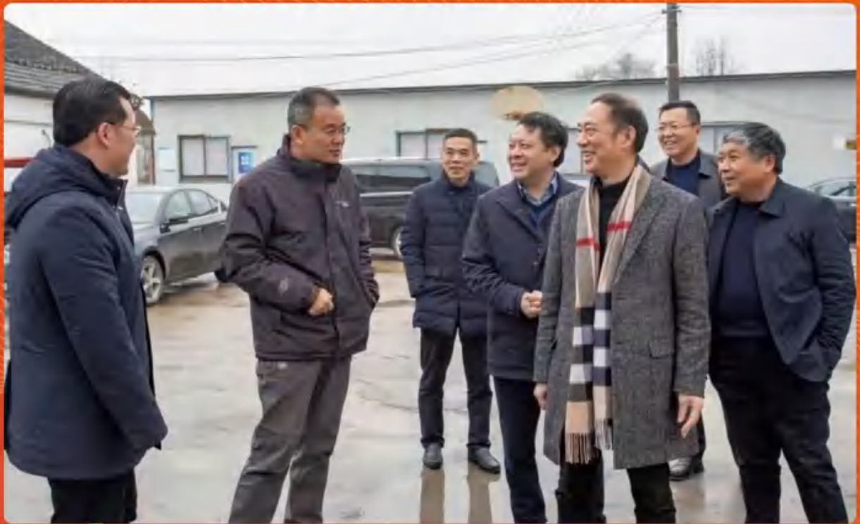
集团赴江都花彭村推进村企联建工作