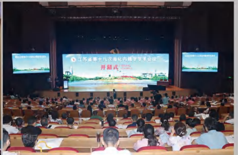
消化内镜学学术会议