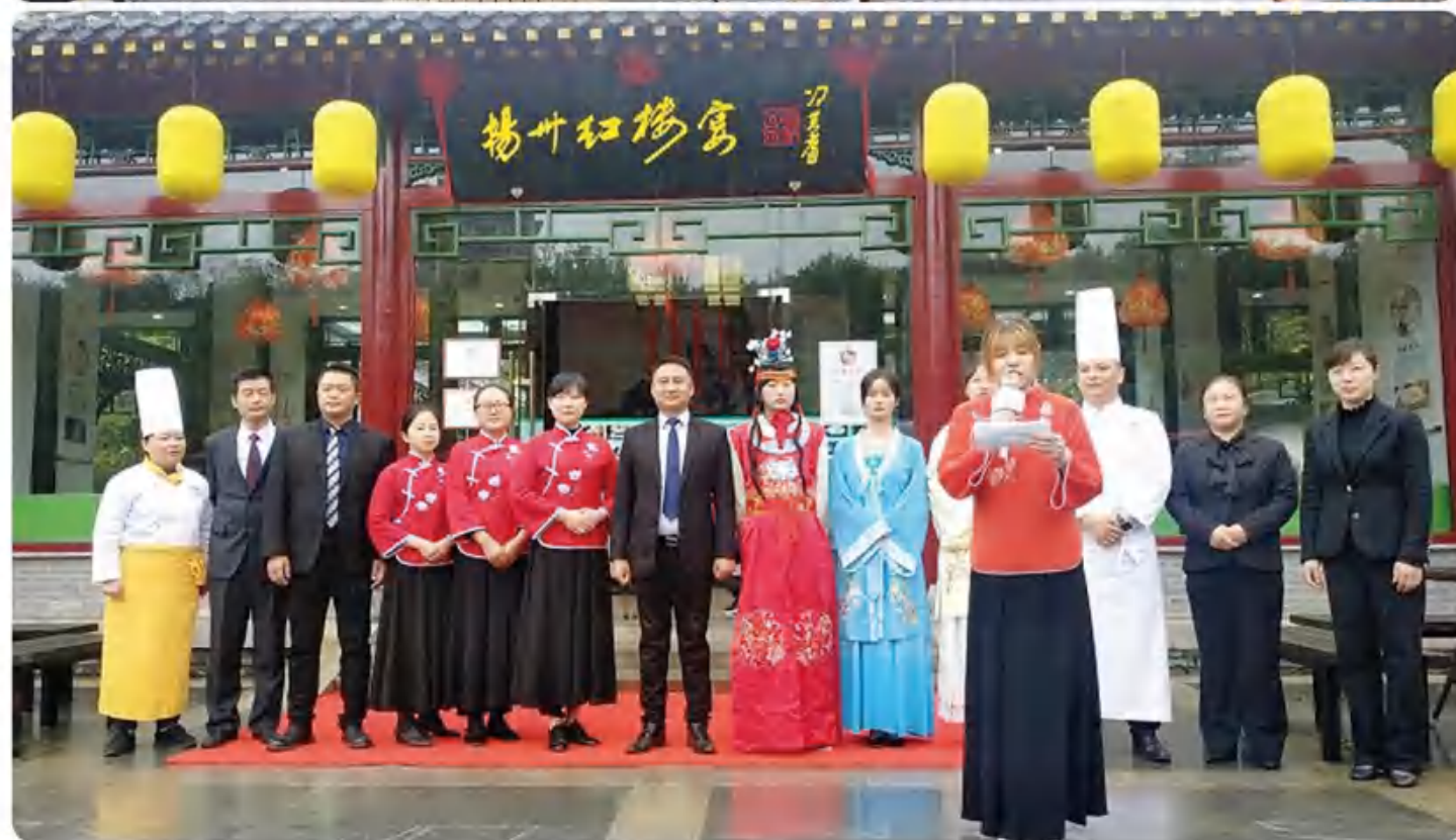
集团打造扬州红楼文化主题餐厅