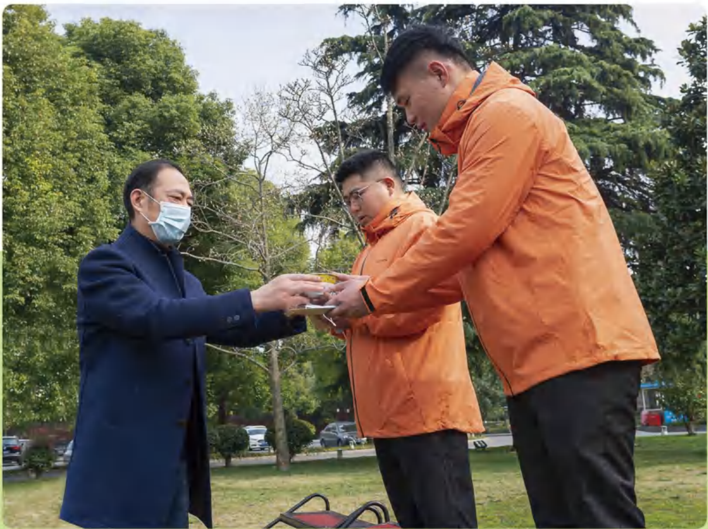
集团第二批驰援武汉厨师启程! 00后报到!