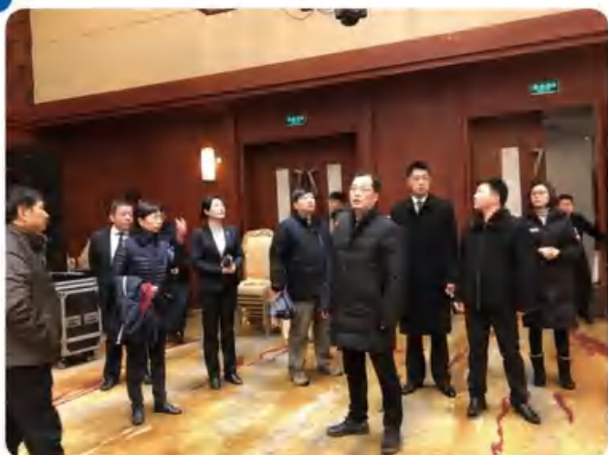
各级领导视察集团企业复工复产情况