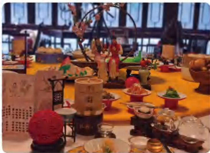
“味道扬州”全国城市台美食采风直播大会在冶春御码头店成功举办