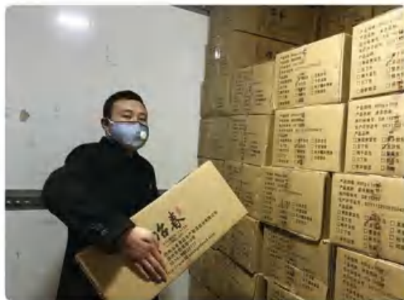
17.2万个冷春包子支持武汉和黄冈战“疫”!