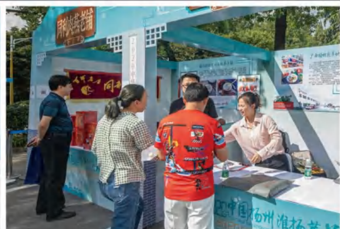
中国扬州淮扬菜美食节