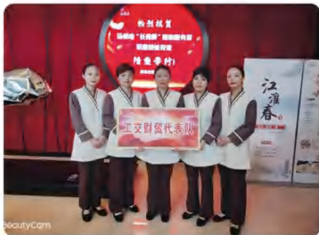
集团参加市“长青杯”客房服务员职业技能竞赛喜获佳绩