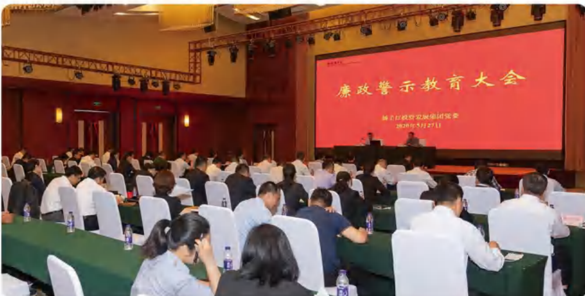
集团党建系列活动