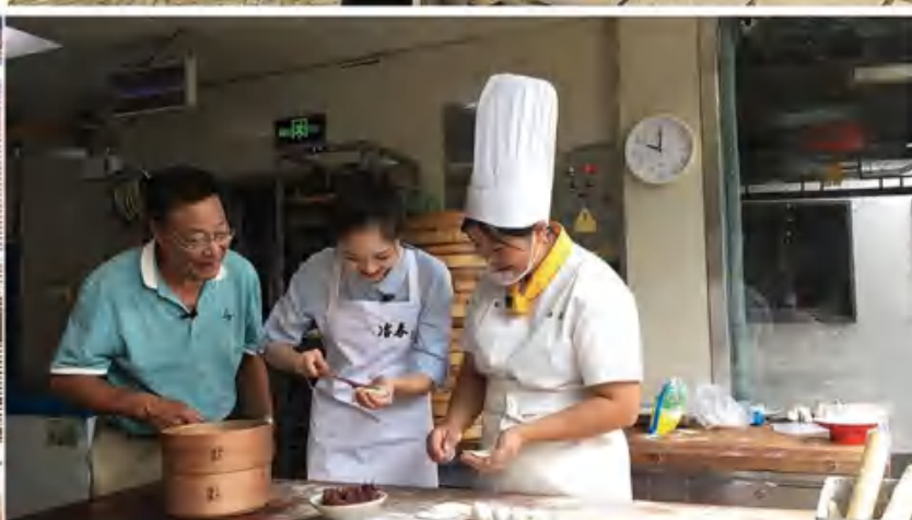
新华社“快看”直播冶春早茶