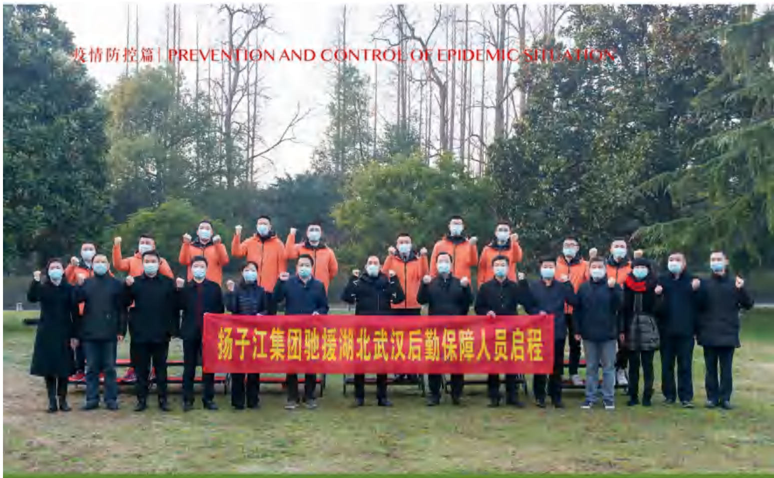
2月20号 家乡的味道来啦! 10名扬州大厨驰援武汉!