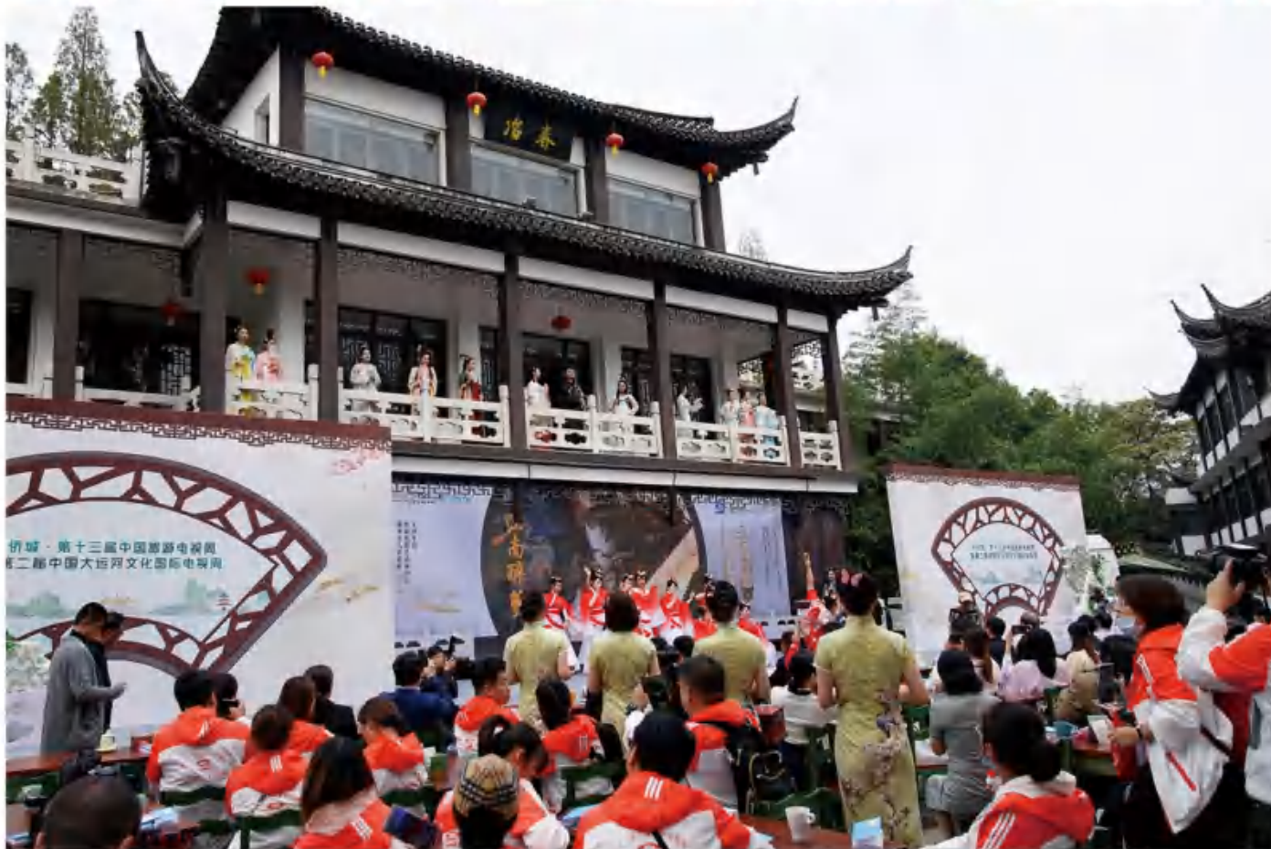
全国60座城市近百家融媒体直播集团淮扬美食