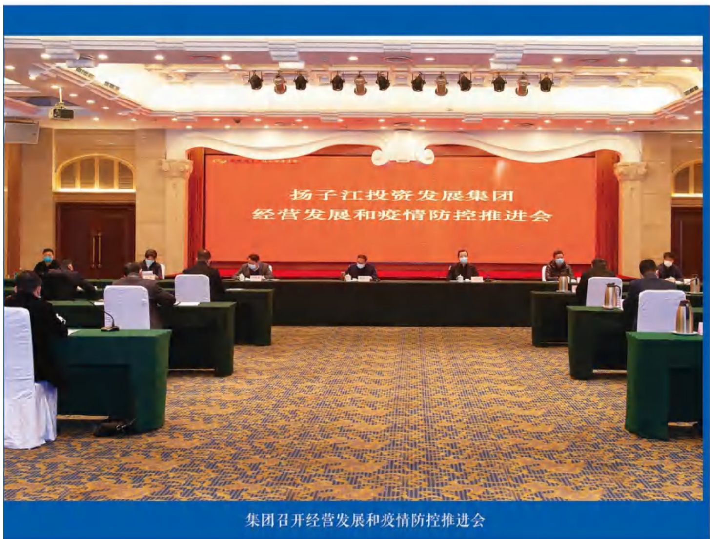
集团召开经营发展和疫情防控推进会