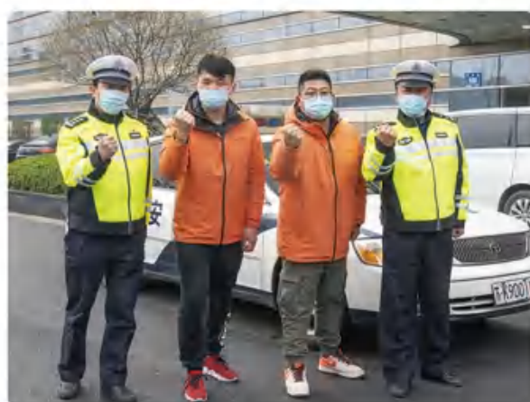
集团第二批驰援武汉厨师启程! 00后报到!