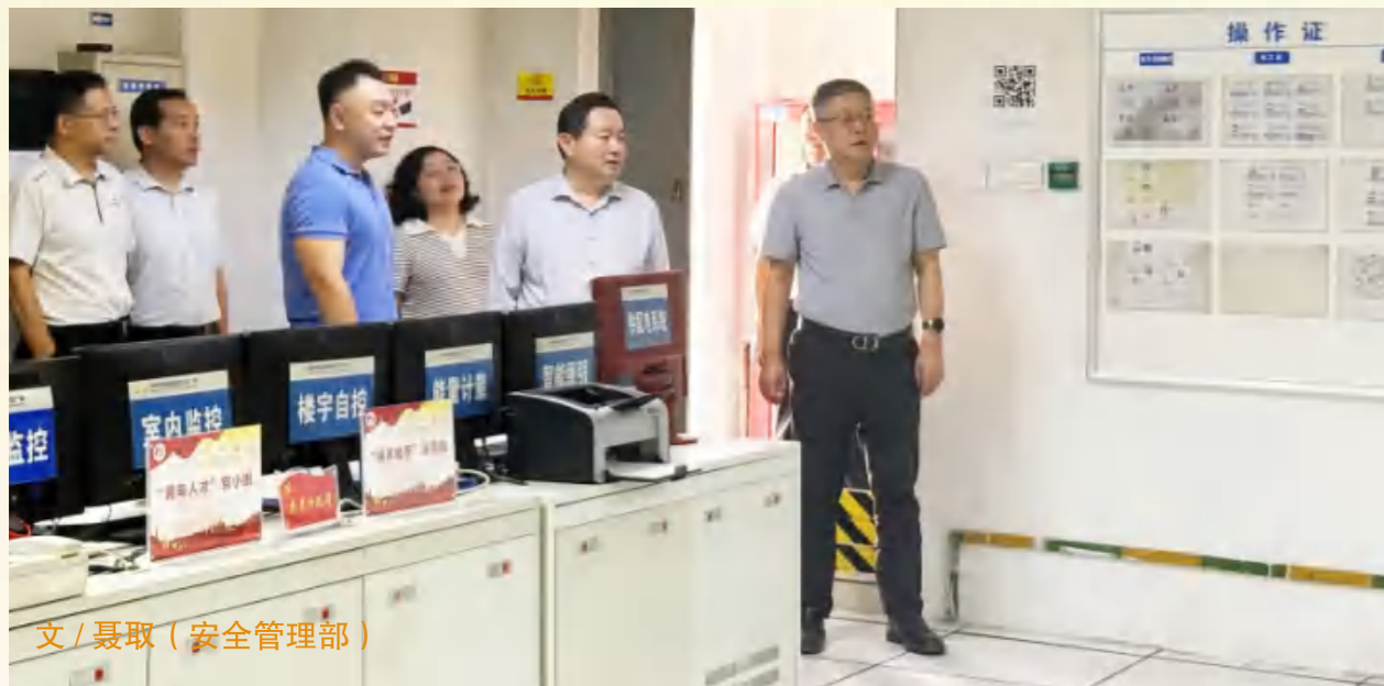
文 / 聂取 (安全管理部)

9月23日上午，市国资委党委书记、主任张思忠带队前往扬子江文旅集团对扬州商城、花园国际大酒店开展安全生产专项检查，扬子江文旅集团总经理张荣、相关单位负责人以及相关职能部门参与检查。