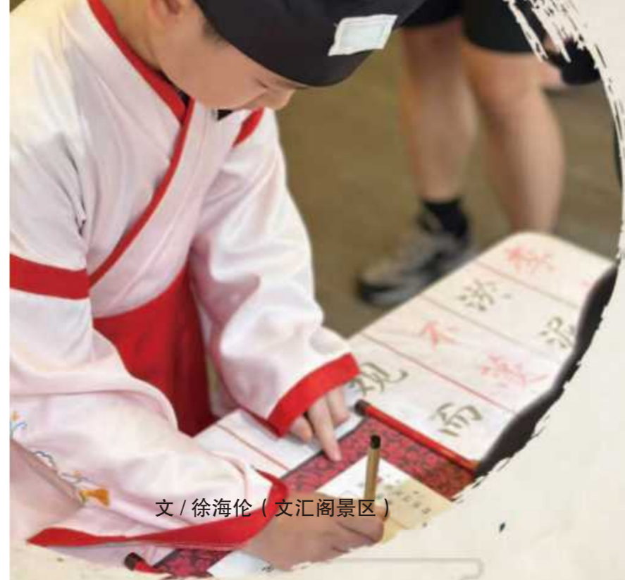
文 / 徐海伦 (文汇阁景区)

文汇阁举办国学 开笔礼公益活动 【为孩童点亮文化传承第一课】 文 / 张卉 (文汇阁景区)